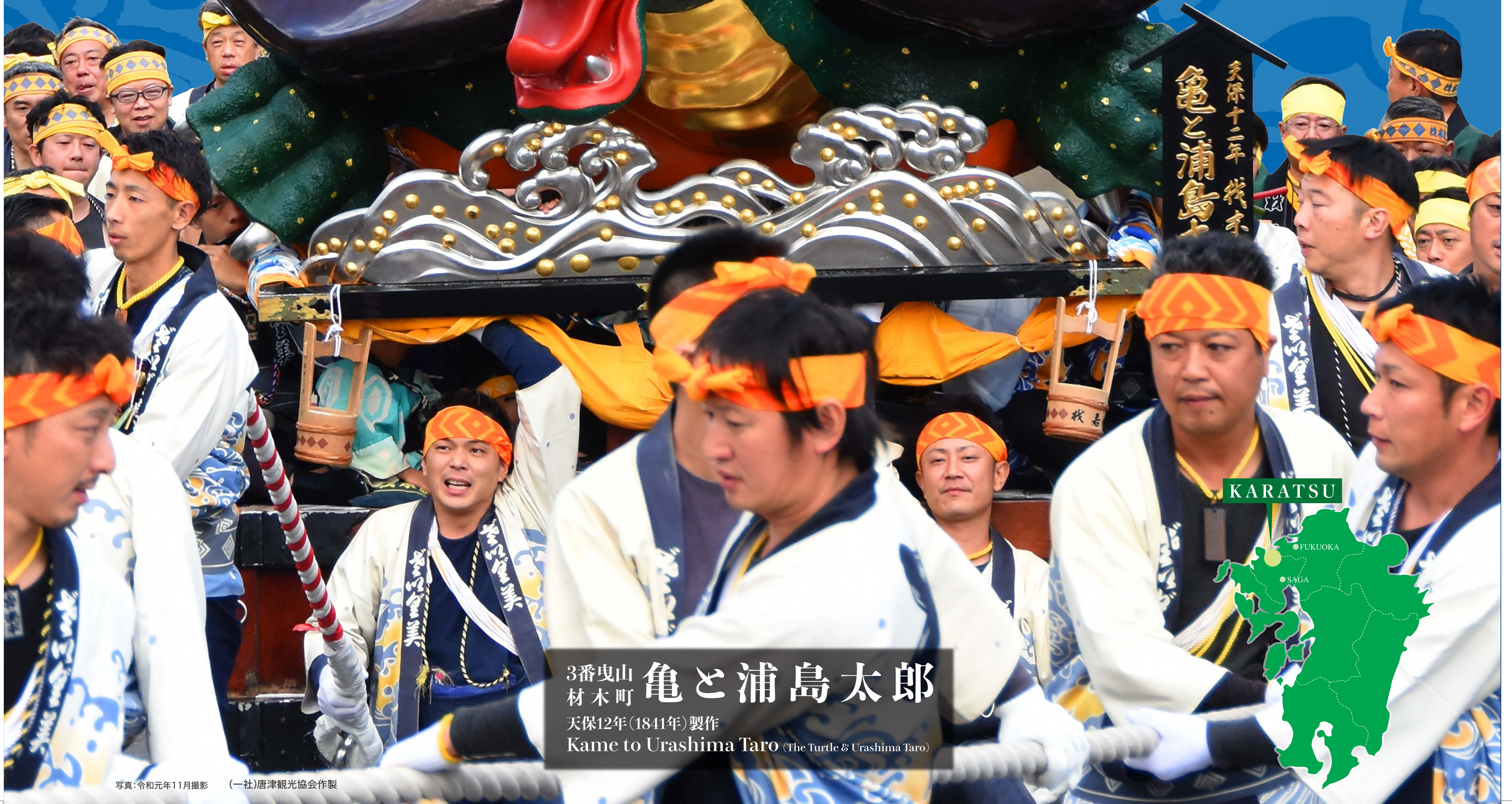
3番曳山 亀と浦島太郎 材木町 天保12年(1841年)製作 Kame to Urashima Taro (The Turtle & Urashima Taro)